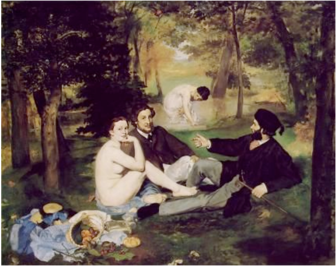
Édouard Manet. 1832 – 1883.