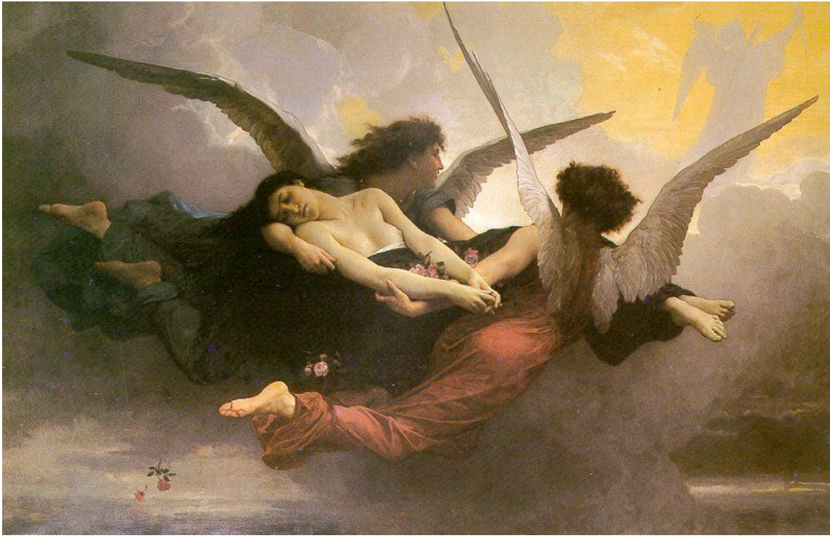
William Bouguereau. 1825 - 1905