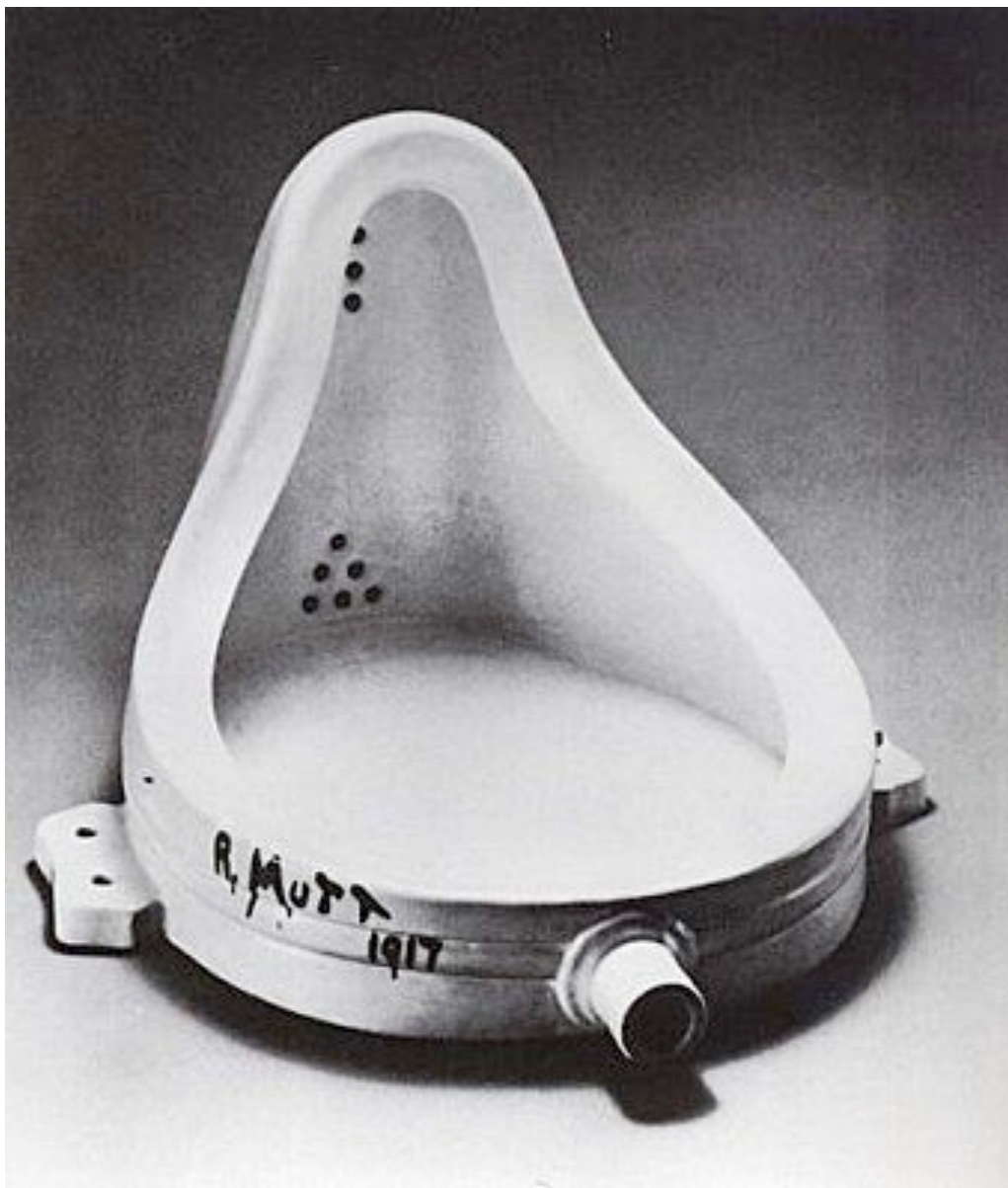
Marcel Duchamp. 1887 – 1968.