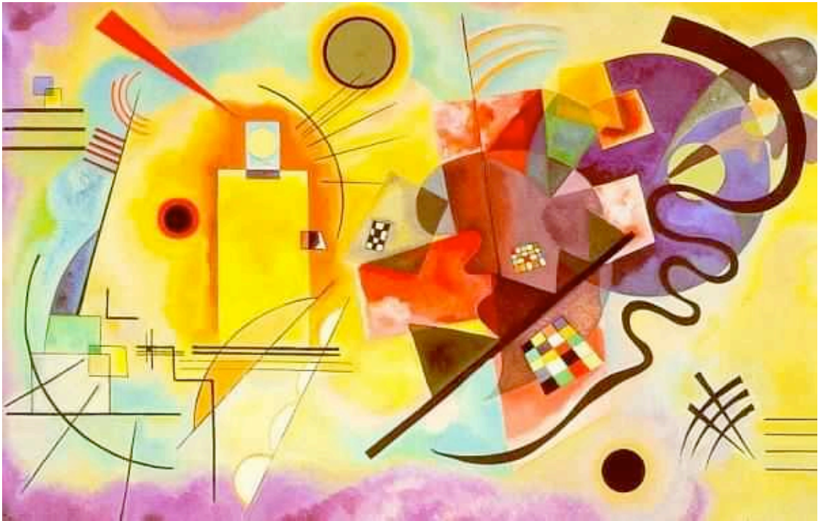
Vassili Kandinsky. 1866 – 1944.