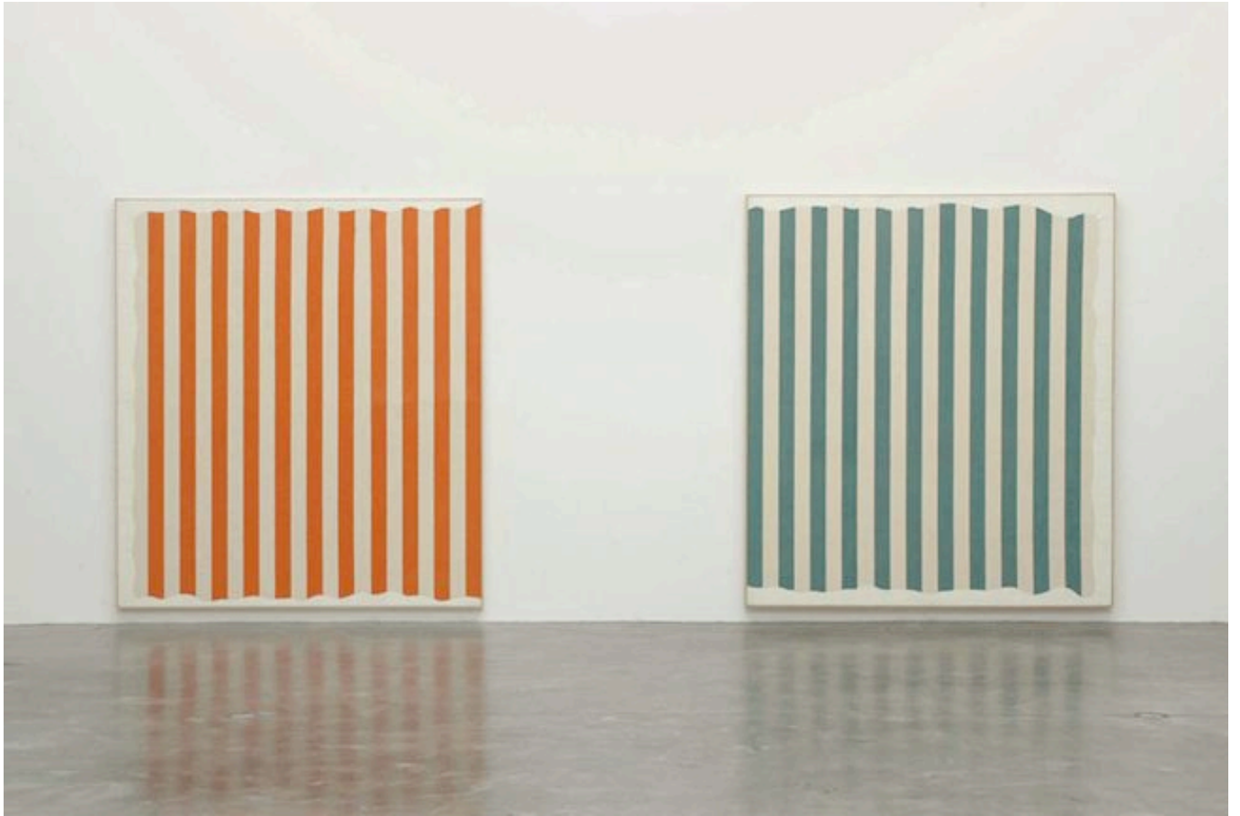
Daniel Buren. Né en 1938.