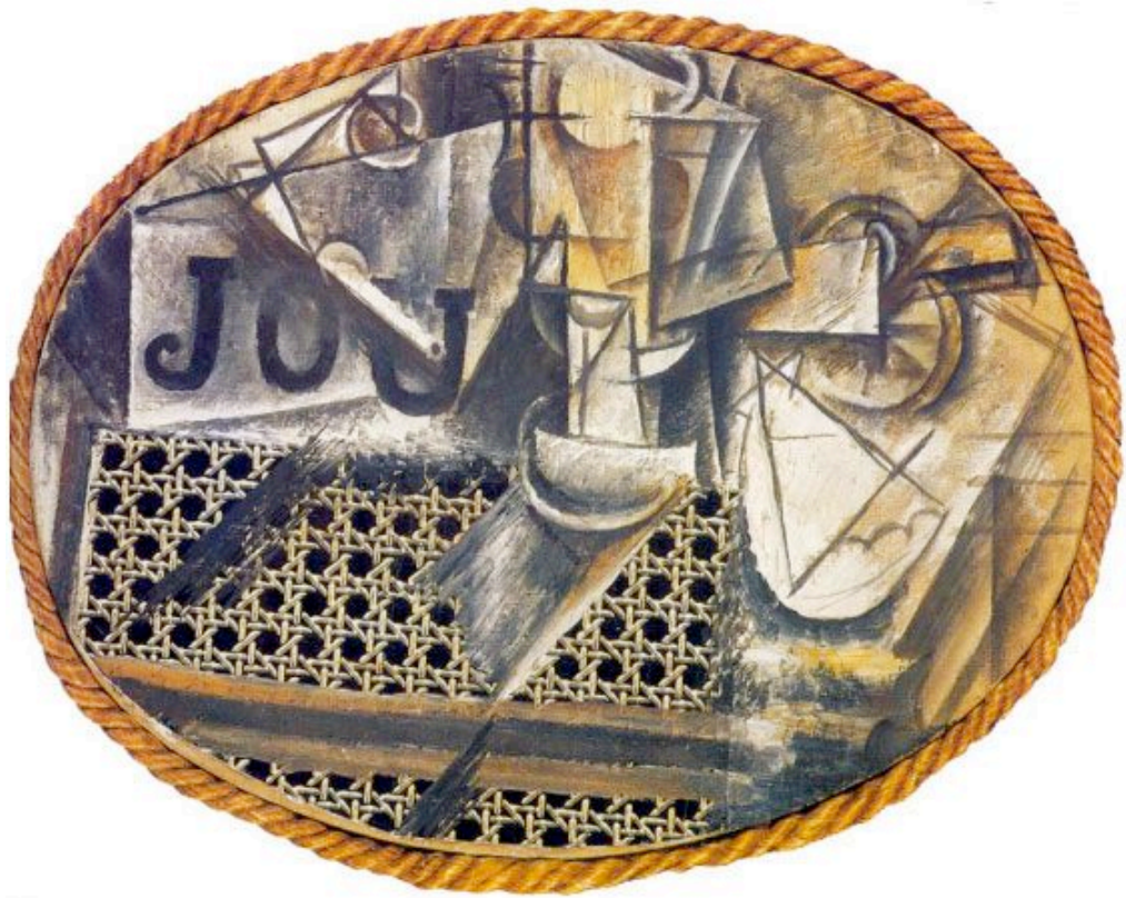
Pablo Picasso. 1881 – 1973.