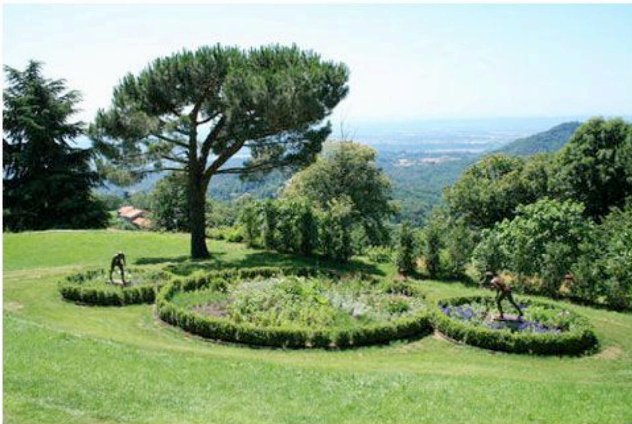
Michelangelo Pistoletto. Né en 1933.