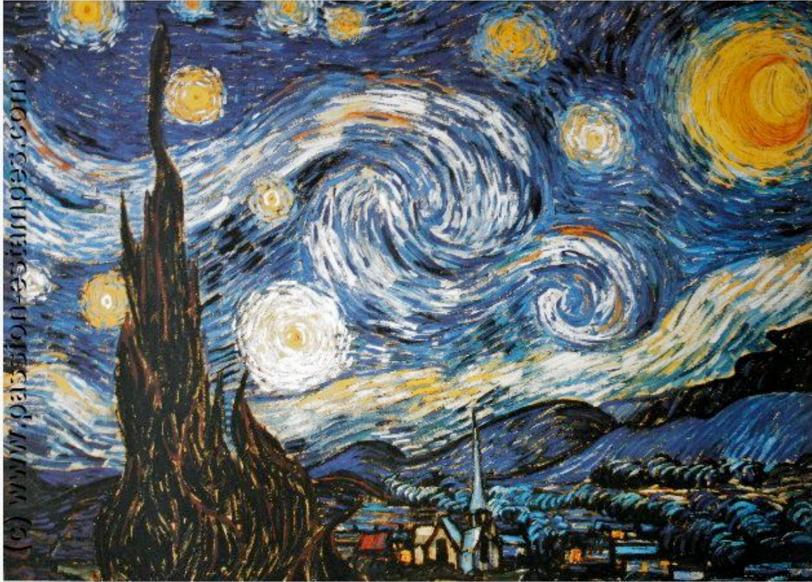
Vincent Van Gogh. 1853 – 1890.