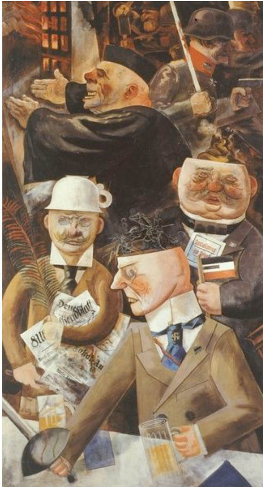
Georg Grosz. 1893 – 1959.