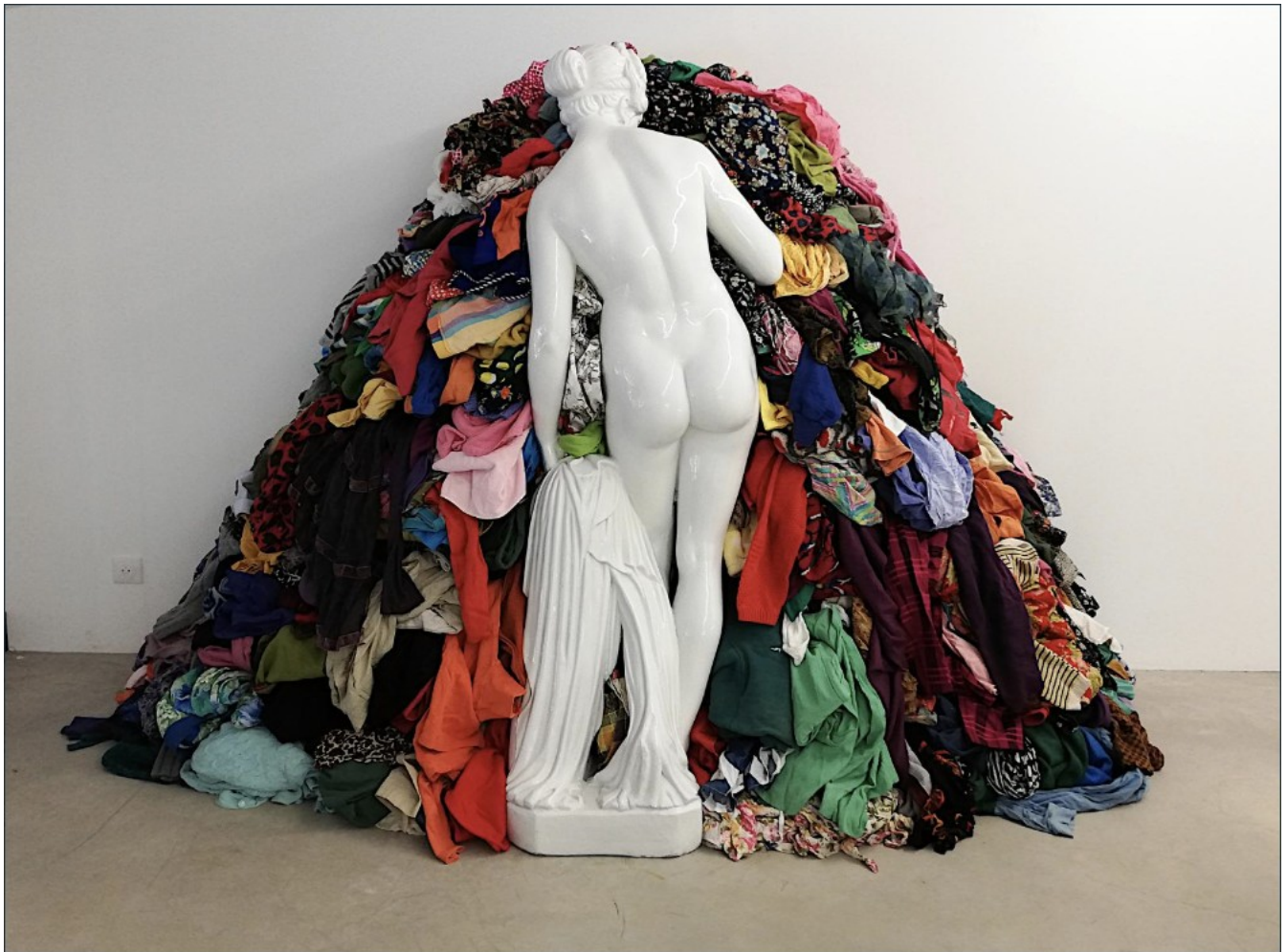
Michelangelo Pistoletto (né en 1933), Venere degli stracci ( La Vénus aux chiffons ), 1967, marbre et chiffons, 190 x 250 x 50 cm.

Il y a plus de cinquante ans, Michelangelo Pistoletto met en avant de manière prémonitrice le concept de « recyclage », avec cette œuvre qui combine une statue de série, copie de l'antique, et dont il n'est donc pas l'auteur, avec un tas de chiffons qui lui servaient habituellement à polir ses tableaux miroirs en inox. Cette pièce est une œuvre mondialement reconnue dans le monde de l'art.