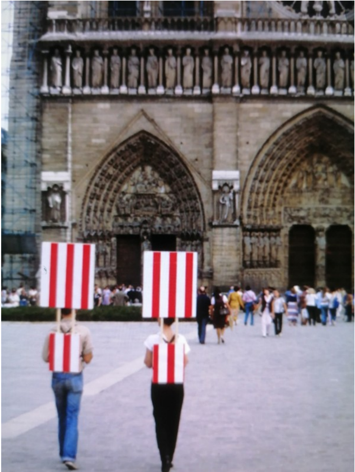
Ici deux personnes font l'homme sandwich pour activer l'œuvre de Daniel Buren devant Notre Dame de Paris.