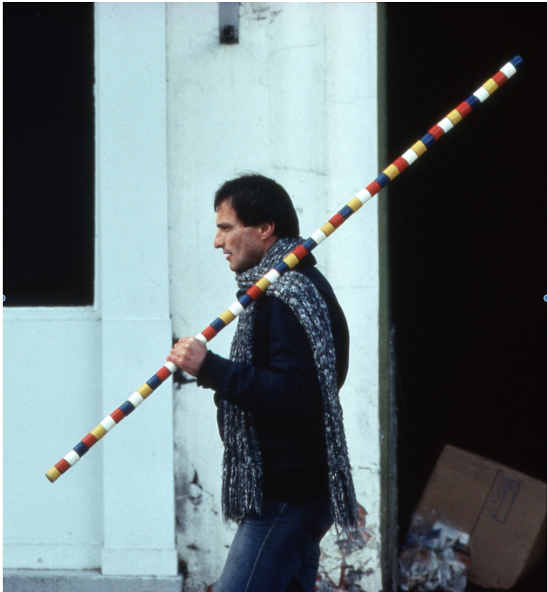
André Cadere (1934-1978). Artiste roumain venu en France au début des années soixante, ayant fréquenté les lieux de l'art contemporain (galeries, vernissages, foires, musées) avec une œuvre portable qui dérangeait les manières habituelles de considérer ce qu'est une œuvre d'art.