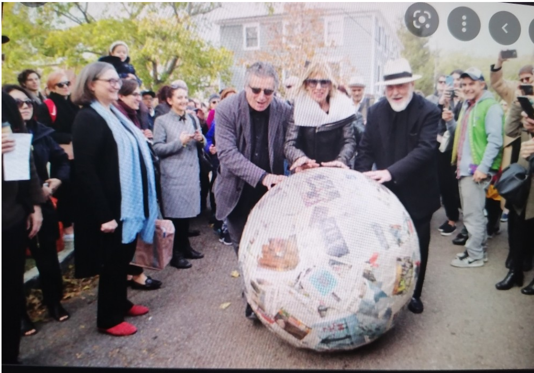
The Architect's Newspaper