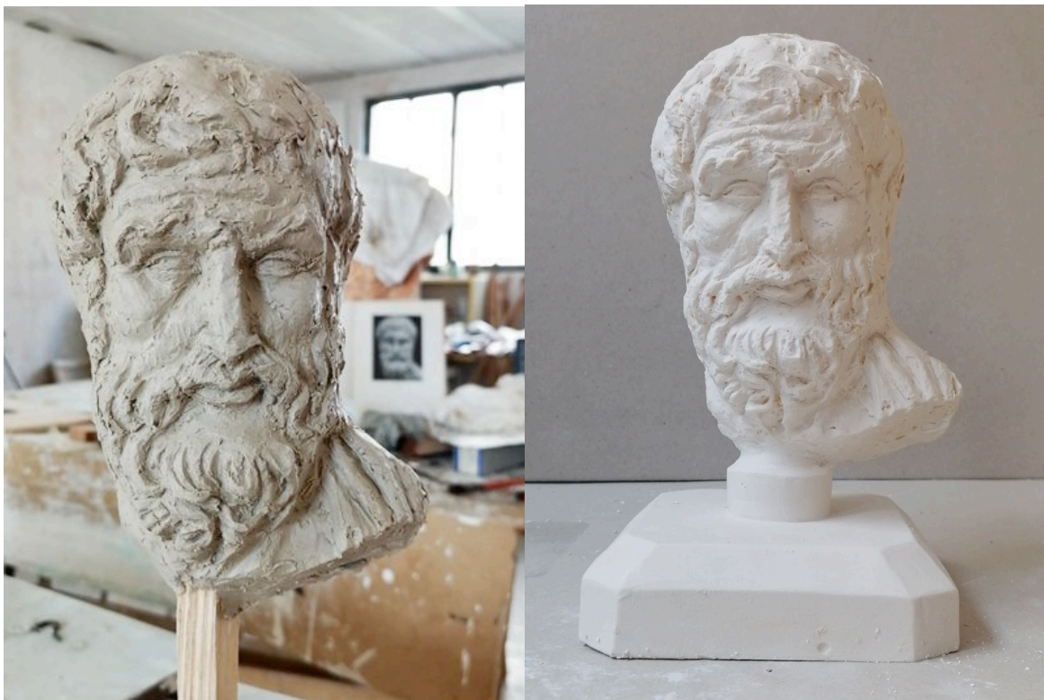
Étude en terre à modeler moulée en plâtre, d'après la sculpture romaine. J. A.

La statuaire romaine est connue pour ses qualités plastiques de réalisme et de synthèse qui peut nous aider à progresser dans le dessin des proportions humaines.