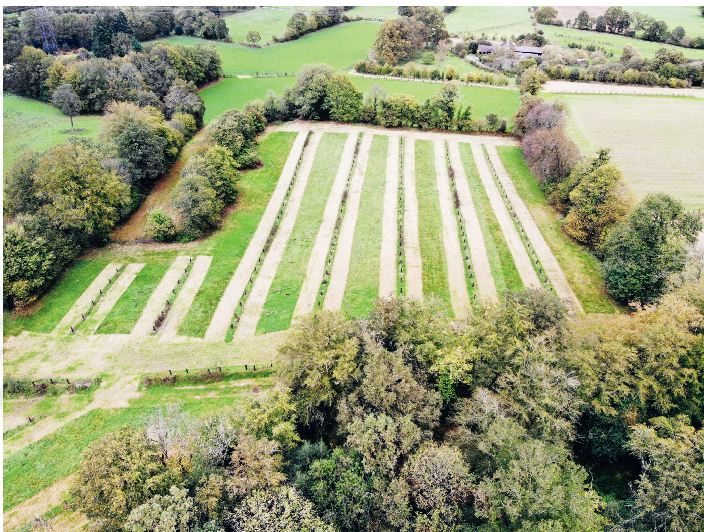
Vue aérienne de plantations de haies et vergers sur la ferme de Mehdi Bezzai.