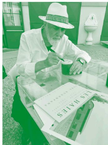
Michelangelo Pistoletto en train d'écrire au feutre les noms italiens des fruits sur les couvercles des confitures produites à partir des fruits de ses vergers et pépinières du Troisième Paradis , rapportées de France. Cittadellarte-Fondazione Pistoletto, juillet 2023.

Figure clé de l'art contemporain, cofondateur de l'Arte povera, Michelangelo Pistoletto a exposé dans les galeries et musées du monde entier et ses œuvres figurent dans les collections des principaux musées d'art moderne et contemporain. Il a créé, dans les années 90 à Biella, Cittadellarte-Fondazione Pistoletto, avec l'objectif d'inspirer et de produire un changement social responsable dans la société à partir de projets créatifs. Il a reçu le Lion d'or de Venise pour toute sa carrière et en 2013 à Paris, le Louvre a accueilli son exposition personnelle Année 1, le paradis sur terre . En 2022, il a publié La Formule de la création , livre qui retrace les étapes de l'évolution de l'ensemble de sa carrière artistique et de sa réflexion théorique. En mars 2025, Michelangelo Pistoletto figure officiellement parmi les candidats pour le prix Nobel de la paix.