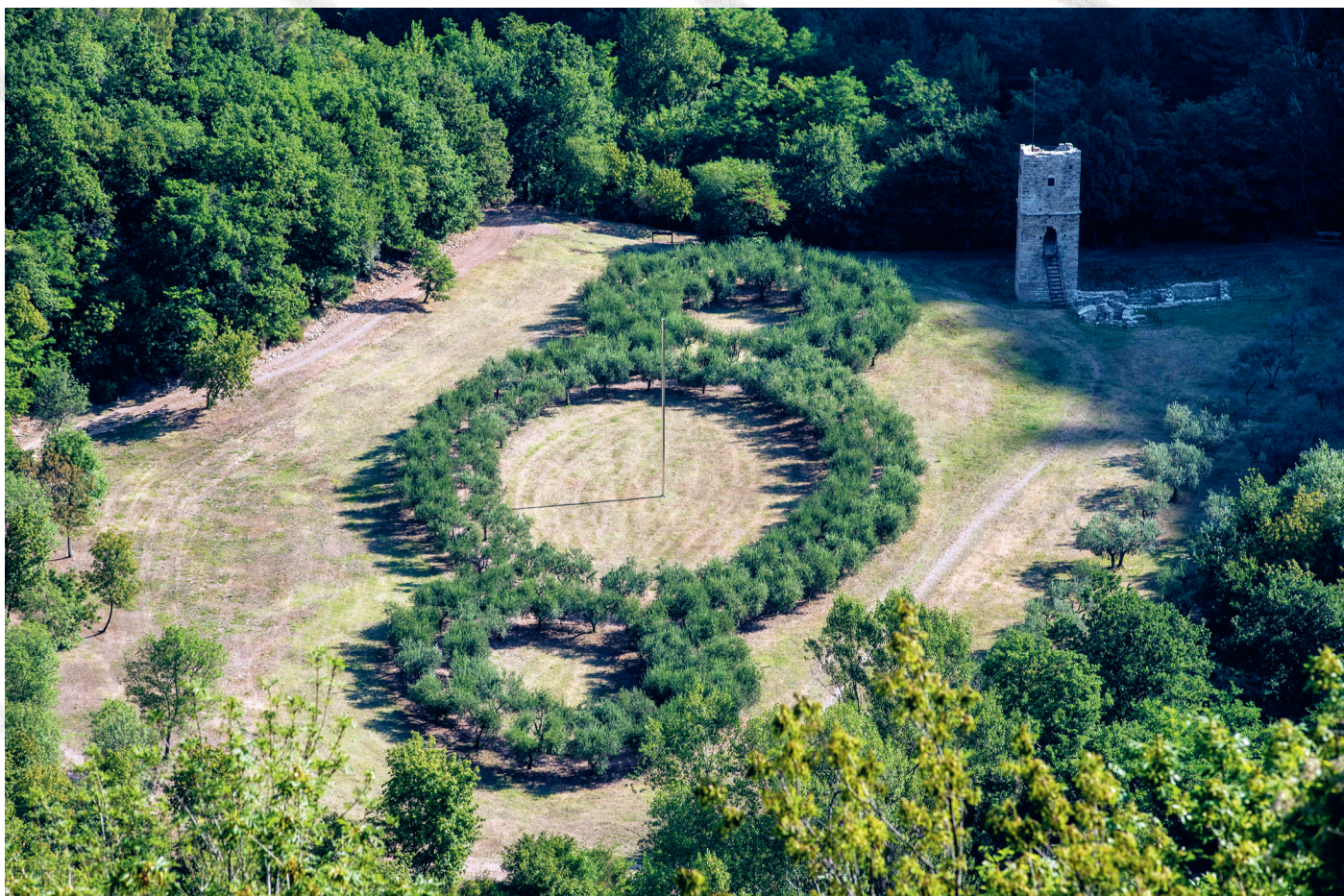
Michelangelo Pistoletto, Le Troisième Paradis dans le bois de Saint-François, Assise, Italie, 2010.